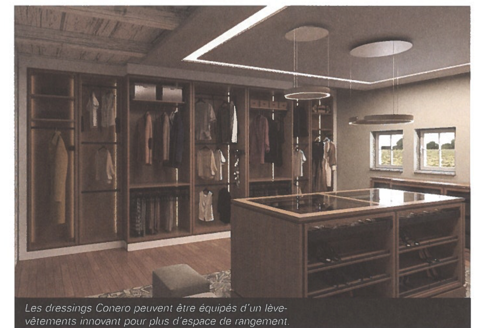
Les dressings Conero peuvent être équipés d'un lève-vêtements innovant pour plus d'espace de rangement.

« LA GAMME CONERO A SURTOUT ÉTÉ CONÇUE POUR LES DRESSINGS INTÉGRAUX, MAIS LES SOLUTIONS PEUVENT ÉGALEMENT SE GREFFER À DES GARDE-ROBES EXISTANTES. »