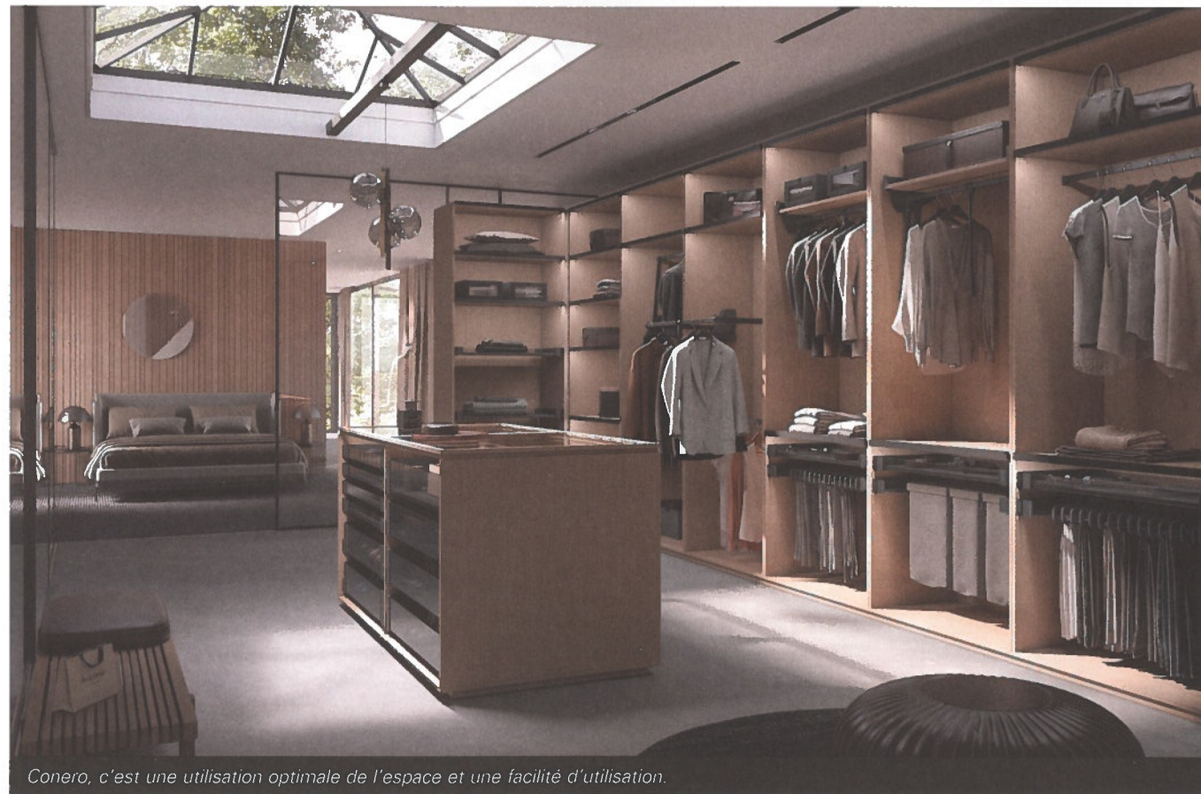
Conero, c'est une utilisation optimale de l'espace et une facilité d'utilisation.

Texte : Stephanie Demasure